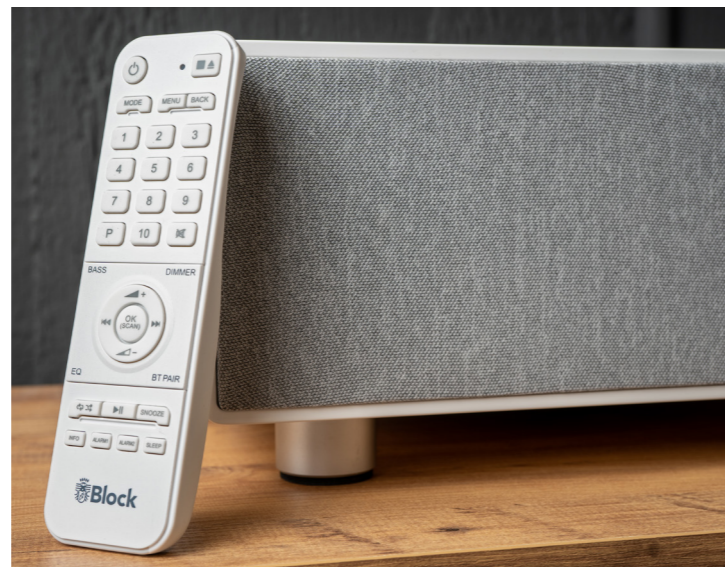
Die Klanganpassung nimmt man idealerweise über die Fernbedienung vor.

Dabei keine Spur von belanglosem Gedudel. Nein, mein Testgast setzt schon hier die ersten Zeichen. Und das, obwohl ich noch gar keine individuellen Einstellungen vorgenommen habe. Dafür benutze ich dann doch die bereits kurz erwähnte Fernbedienung. Rund um den Cursor, über den ich auch die Lautstärkejustage vornehme, finden sich vier Tasten. Um Einstellungen am Klang vorzunehmen, sind „Bass“ und „EQ“ am wichtigsten. Drücke ich „Bass“, schaltet sich der Subwoofer zu und der Sound wirkt deutlich voluminöser und körperhafter. An Bass mangelte es vorher nicht wirklich, doch die Aktivierung gefällt mir jetzt einfach besser. Letztlich ist das aber immer vom gewählten Musikgenre und vom eigenen Hörgeschmack abhängig. Und wenn es bei einem Stück irgendwann mal zuviel Bass sein sollte, genügt ein Knopfdruck, um die Intensität zu reduzieren. Die Taste „EQ“ hat dagegen insgesamt neun Presets zu bieten. Beispielsweise für „Nachrichten“, „Jazz“, „Rock“ oder „Klassik“, um nur einige zu nennen.