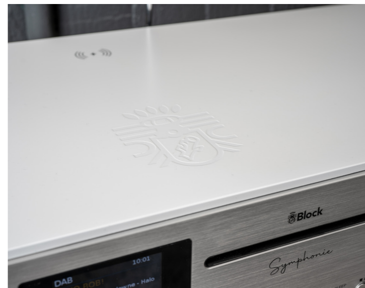
Ein Block-Produkt erkennt man am Wappen. Dieses ist hier in die Gehäuseoberseite eingelassen.

Meine ausgiebige Untersuchung beginne ich traditionell beim Äusseren. Und bereits hier hat das Block einiges zu bieten. Um ganz ehrlich zu sein: Als ich das Symphonie erstmalig auf der IFA sah, empfand ich es als etwas zu wuchtig. Jetzt, wo das Smartradio fernab von anderen Ausstellungsstücken auf dem Lowboard in unserem Hörraum steht, empfinde ich die Proportionen aber als sehr gut gelungen. Das Verhältnis von Breite, Höhe und Tiefe stimmt einfach und passt sich sehr gut ins Wohnambiente ein. Dazu trägt auch die exzellent aufgetragene Lackoberfläche bei. Dieses leicht schimmernde Kleid, kombiniert mit den im edlen Silbergrau gehaltenen Lautsprecher-Abdeckungen, lässt das Symphonie wirklich edel erscheinen. Alternativ gibt es dieses Modell auch in schwarzer oder anthrazitfarbener Ausführung. Tatsächlich gefällt mir die weiße Variante aber am besten. Vielleicht auch, weil diese Version mit silberfarbenem Bedienfeld kommt. Die anderen beiden Ausführungen sind dagegen mit tiefschwarzen Panels und Tasten ausgestattet.